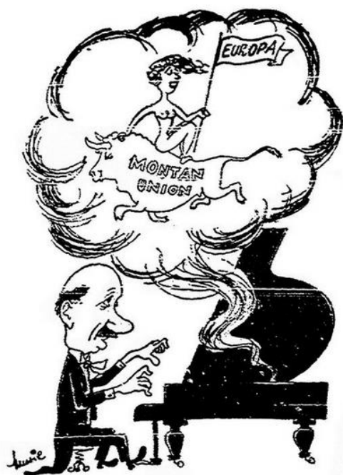
„Träumerei“ von Robert Schuman

przede wszystkim jako francuski minister spraw zagranicznych (1948-1952). To właśnie pełniąc to stanowisko ogłasza 9 maja 1950 roku słynny plan Schumana. Prawdziwy autor planu to jednak Jean Monnet , który przyszedł ze swoim pomysłem do ówczesnego ministra spraw zagranicznych Francji. Zasluga Schumana polega na tym, że odważył się firmować i zrealizować ten plan, jako minister wziął odpowiedzialność za pomysły zawarte w tej propozycji – nawiązanie współpracy z Niemcami zaledwie kilka lat od zakończenia krwawego konfliktu. Schuman był zresztą zwolennikiem francusko-niemieckiego pojednania już w okresie międzywojennym. Plan Schumana stał się fundamentem Europejskiej Wspólnoty Węgla i Stali (EWWiS). Rozpoczął proces integracji europejskiej i pojednanie europejskich narodów po II wojnie.