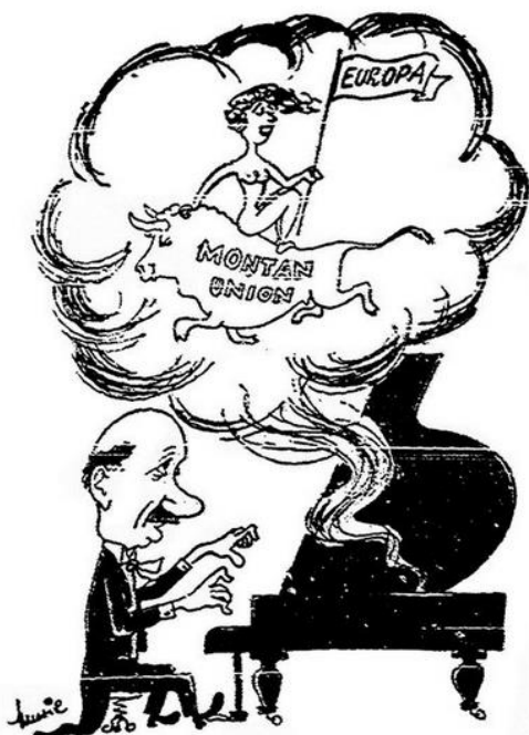
„Träumerei“ von Robert Schuman

przede wszystkim jako francuski minister spraw zagranicznych (1948-1952). To właśnie pełniąc to stanowisko ogłasza 9 maja 1950 roku słynny plan Schumana. Prawdziwy autor planu to jednak Jean Monnet , który przyszedł ze swoim pomysłem do ówczesnego ministra spraw zagranicznych Francji. Zasluga Schumana polega na tym, że odważył się firmować i zrealizować ten plan, jako minister wziął odpowiedzialność za pomysły zawarte w tej propozycji – nawiązanie współpracy z Niemcami zaledwie kilka lat od zakończenia krwawego konfliktu. Schuman był zresztą zwolennikiem francusko-niemieckiego pojednania już w okresie międzywojennym. Plan Schumana stał się fundamentem Europejskiej Wspólnoty Węgla i Stali (EWWiS). Rozpoczął proces integracji europejskiej i pojednanie europejskich narodów po II wojnie.