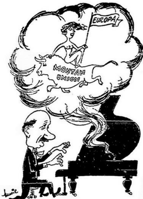
„Träumerei“ von Robert Schuman