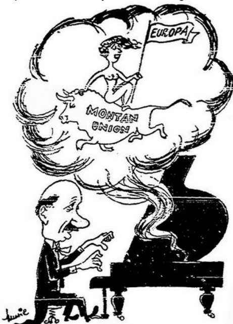
„Träumerei“ von Robert Schuman